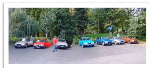
Une bien belle brochette !