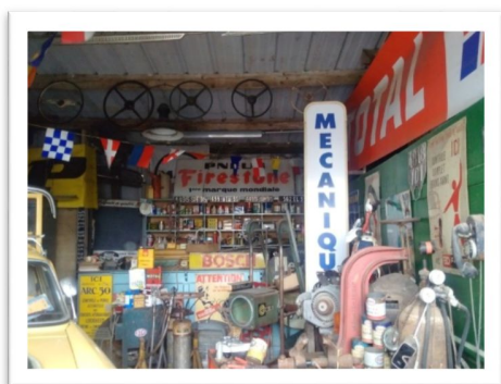
La Station 70

Je tiens à remercier tous les participants dont la bonne humeur et l'enthousiasme ont fait le succès de ce week end.