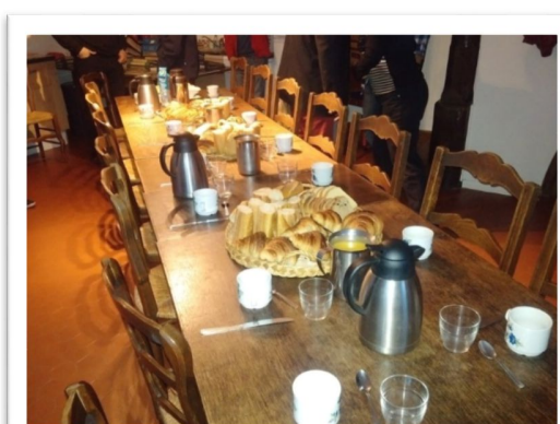
Une AG studieuse et appétissante !