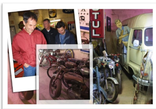
La Station 70