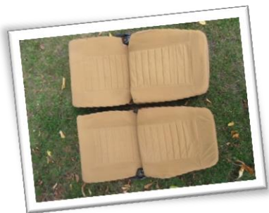
Voici un exemple de pièce d'occasion que le Club a à votre disposition.